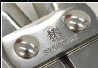
大きめのリベットを使用し、逃げ刃を防止。