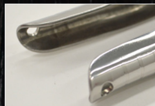
落下防止コード取付け穴付き。