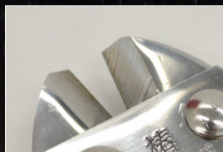
高炭素ステンレス鋼の刃

刃部に高炭素ステンレス鋼を使用しているため、切れ味良し！耐久性に優れています。金属部は細部にまでステンレスを使用しているため、錆びにくく長寿命が期待できます。