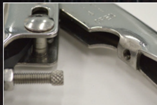
追加のバネ取付け可能